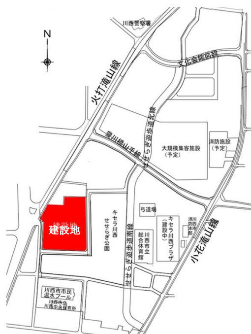
建設地は浸水が予想される区域

高速度道路も閉鎖、市内の道路が通行止めになり、立派な病院ができて救急車も通り着くことができません。南北に細長い川西市の地形を考えると現川西病院を存続しリスクを回避することが必要ではないでしょうか。 現川西病院は、閉鎖し北部診療所を整備する計画になっていますが、診療体制は、内科、整形外科、小児科、外科のみで24時間急病対応は内科1診のみ、入院も手術もできません。(仮称)川西市立総合医療センター間のシャトルバスを運行するから大丈夫?これでは、北部地域はもろろん、市民の命と健康は守れません