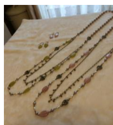
(ビーズアクセサリ)

子育てをしている頃、ママたちとワイワイお茶をしながらトールペイントや小物づくり。たくさん作ってフリーマーケットや幼稚園、学校のバザーにせっせと出していました。今は、そんな時間の余裕がなくなりましたが、時々近所の方と一緒に大好きな手作りの時間を楽しみにしています。