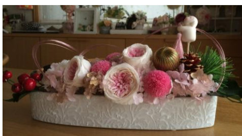
(プリザーブドフラワーのアレンジ)