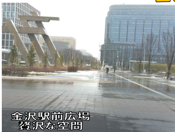
金沢駅前広場 贅沢な空間

昨年3月、北陸新幹線開通し、新幹線バブルだとか。外国からの観光客もかなり多いそうです。