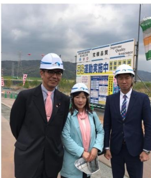
宮本岳志衆議院議員(左) 清水ただし前衆議院議員

※PFIとは: 民間の資金と経営能力・技術力(ノウハウ)を活用し、公共施設等の設計・建設・改修・更新・維持管理・運営を行う公共事業の手法の一つです。